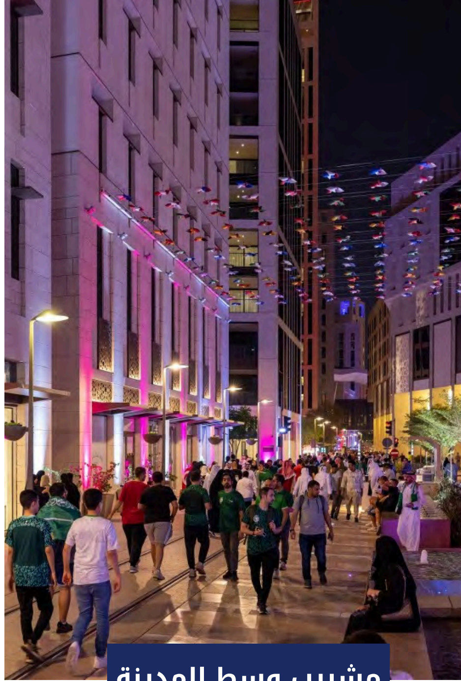
مشيرب وسط المدينة