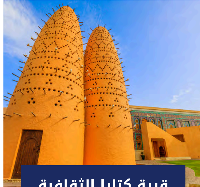
قرية كتارا الثقافية